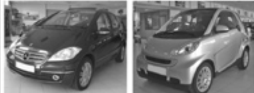
MERCEDES A 180 CDI Aut. 2009 SMART 52 MHD PASSION 2009